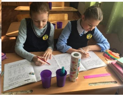
Игра «Палитра эмоций», занятие. Игра «Путь в будущее»